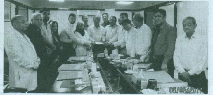
CMOSH ক্যাম্পার হাসপাতাল ও রিসার্চ ইনস্টিটিউটের জন্য অনুদানের চেক হস্তান্তর করছেন বাংলাদেশ কমিউনিস্ট এন্ড ড্রাগিস্টস্ সমিতির নেতৃত্বন্দ।