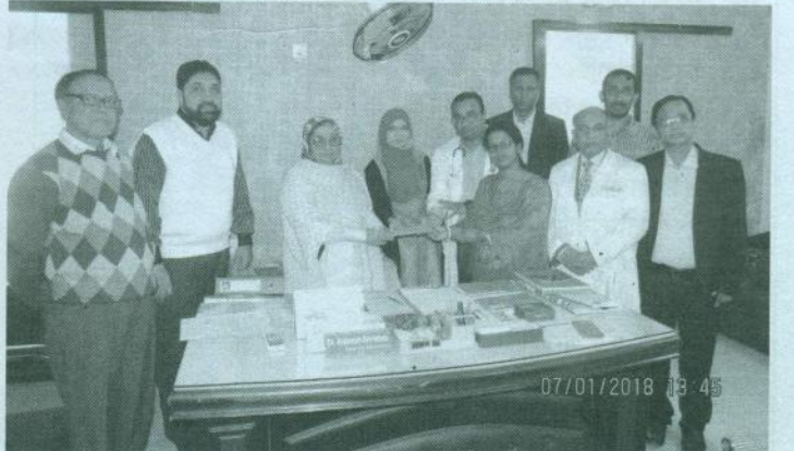
চট্টগ্রাম মা ও শিশু হাসপাতালের ইনস্টিটিউট অব চাইল্ড হেলথ-এর ডিসিএইচ স্টুডেন্টদের পক্ষ থেকে ক্যাম্পার হাসপাতালের জন্য অনুদানের চেক হস্তান্তর করা হচ্ছে